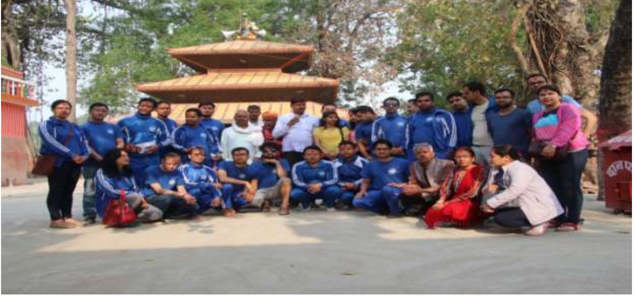
गडीमाई मन्दिर परिसर भित्र