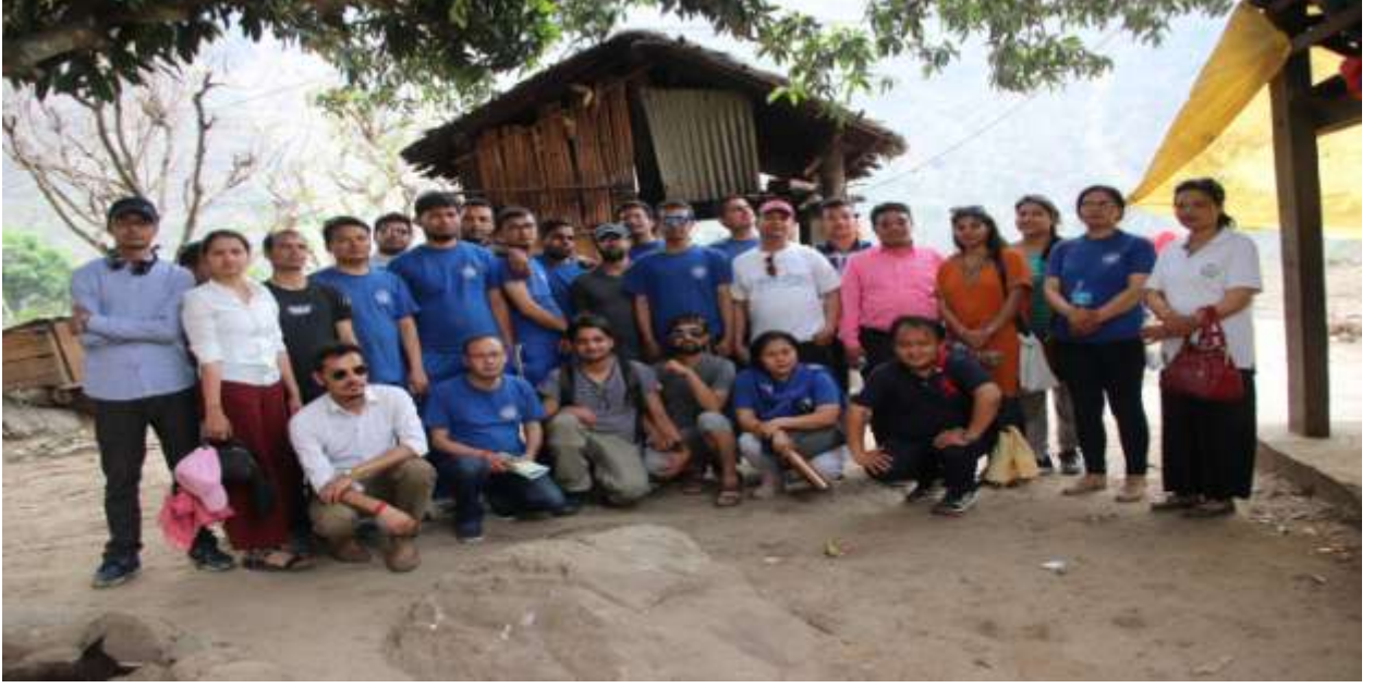
चेपाड समुदायसँग छलफल पछि