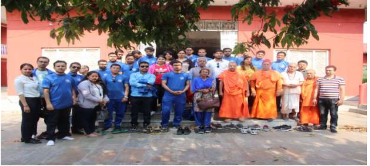
देवघाट परिसर भित्र